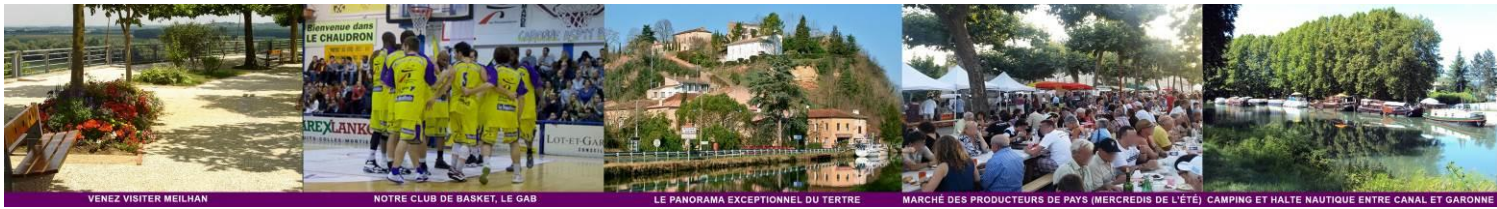
VENEZ VISITER MEILHAN