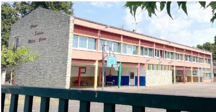
Figure 1 : Façade du bâtiment étudié

Le système proposé dans cette étude est une centrale de 225 modules photovoltaïques de 400 Wc chacun couvrant une surface de 437 m 2 . La puissance totale de l'installation est fixée à 90 kWc. La technique de pose est une intégration simplifiée au bâti, c'est-à-dire une surimposition par rapport à la couverture en tuiles. L'injection de l'énergie produite aura lieu au niveau du transformateur situé à proximité